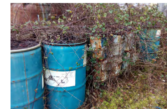
Sol pollué (76)