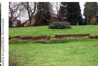
Glissement de terrain (61)