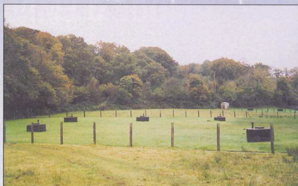
Le périmètre immédiat de Fontenay (La Haye-du-Puits)

Ils sont composés d'une zone de protection immédiate de quelques ares, d'une zone de protection rapprochée de quelques hectares et d'une zone de protection éloignée correspondant au bassin versant.